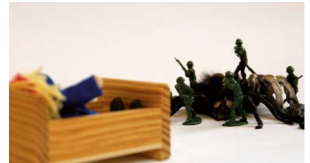
Nachgestellte Szene in der Therapie

Wir, die Fachkräfte im Team der KJA, arbeiten sehr eng mit den Kolleg:innen der anderen Fachabteilungen des Zentrum ÜBERLEBEN zusammen. So stellen wir sicher, dass sowohl soziale, als auch rechtliche Aspekte in der Beratung und der Psychotherapie bearbeitet werden können.