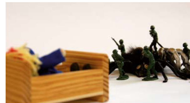
Nachgestellte Szene in der Therapie

Wir, die Fachkräfte im Team der KJA, arbeiten sehr eng mit den Kolleg:innen der anderen Fachabteilungen des Zentrum ÜBERLEBEN zusammen. So stellen wir sicher, dass sowohl soziale, als auch rechtliche Aspekte in der Beratung und der Psychotherapie bearbeitet werden können.